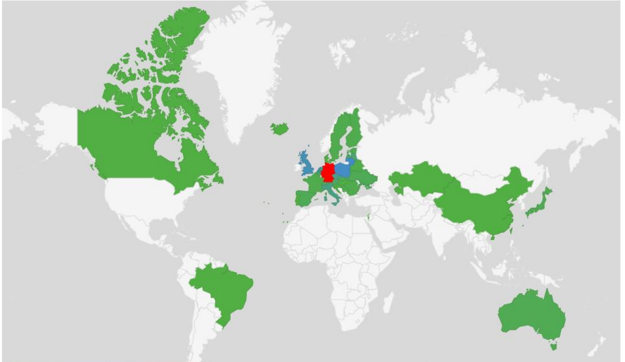
2 pav. Europos geografinio centro lankytojų geografinis žemėlapis, 2024 m.

Didžioji dalis turistų, 2024 m. aplankiusių EGC, buvo užsieniečiai, atvykę iš Vokietijos, Lenkijos, Jungtinės Karalystės, Olandijos, Čekijos, Italijos, Latvijos, Austrijos, Šveicarijos, Belgijos, Estijos, Ispanijos, JAV, Slovakijos ir kt. Šio turistinio sezono metu Europos geografinį centrą aplankė turistų grupės iš tolimesnių šalių - Brazilijos, Japonijos, Kanados, Kinijos, Taivano, Kazachstano ir Australijos. 2 paveiksle pateikiamas geografinis turistų, apsilankiusių EGC 2024 m., žemėlapis.